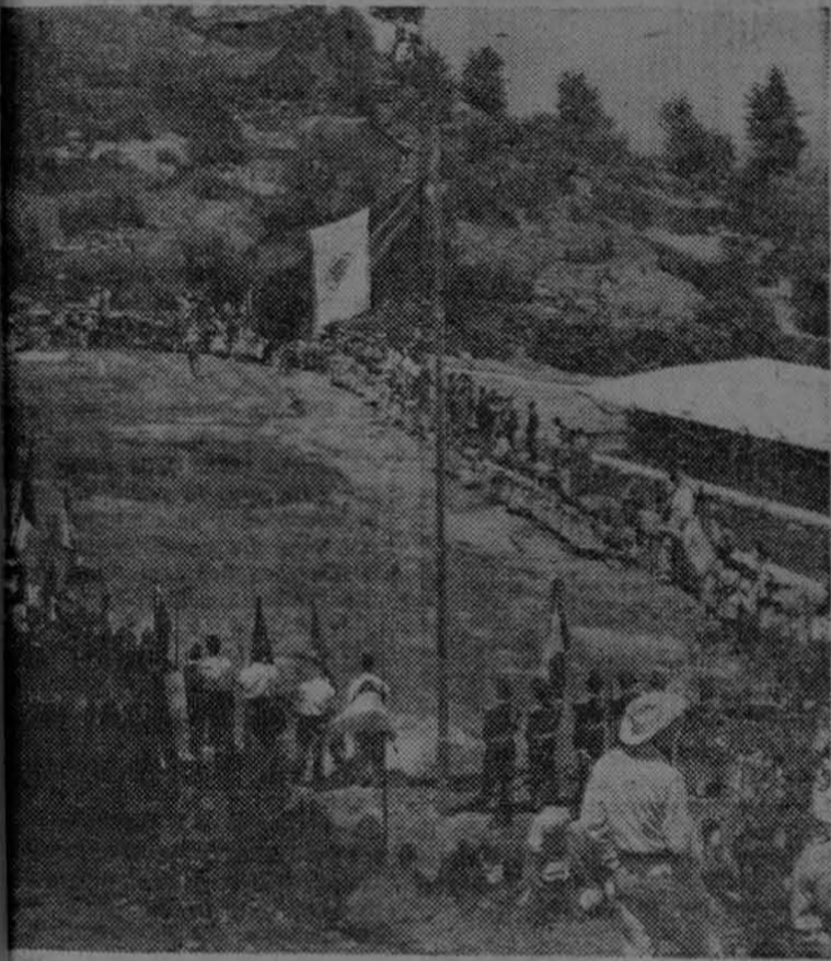
solemne momento en que la enseña nacional mexicana era izada en el campo de juego de la nueva escuela de Magdalena Petlacalco, Distrito Federal, que ha sido donada a dicho pueblo por los miembros de la sección "Alan Seeger", número dos de la Legión Americana, establecida en México.

La amistad mexicana-norteamericana se ha manifestado, una vez más, en un acto sencillo, nada ostentoso, que tuvo lugar recientemente sobre el viejo camino de la capital mexicana Cuernavaca.