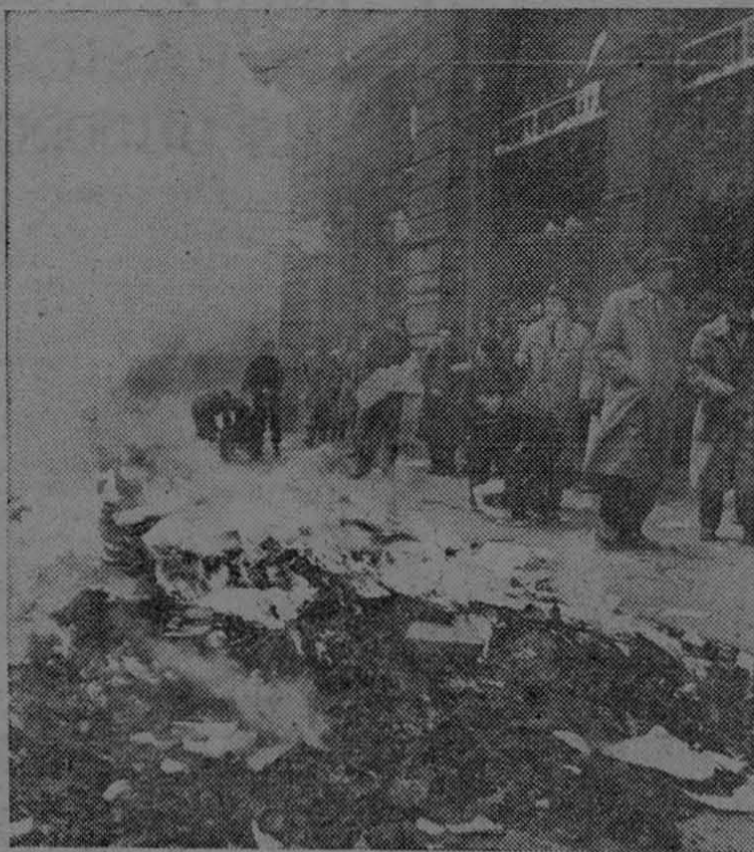
Hasta los niños participaron en la revuelta libertaria de Hungría, quemando en las calles los odiados libros de texto escritos en ruso que les habían sido impuestos por las autoridades escolares soviéticas. Aquí aparecen estudiantes y trabajadores de Budapest quemando libros y grabados extraídos de la Biblioteca Soviética y de la librería "Horizonte", en la plaza Kossuth Lajos, de Budapest, en los primeros y victoriosos días de la revolución por la libertad.