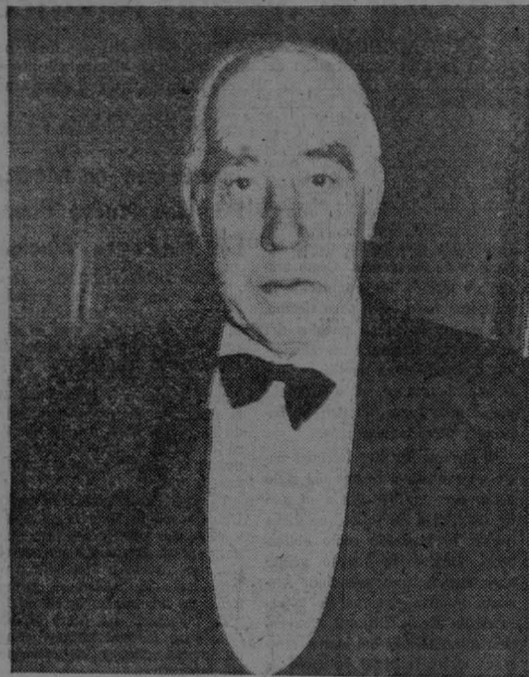
Profesor Niels Bohr, Premio Nóbel, del Instituto de Física Teórica de Copenhague, Dinamarca.